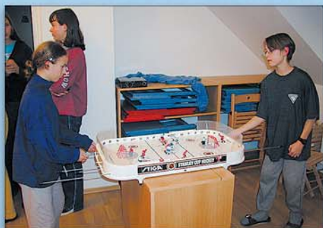
...měli jsme si o čem povídat, takže jsme se rozhodně nenudili...