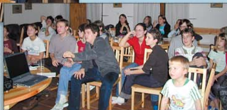
...i když jsme byli unavení, vyčkali jsme až do večera a mohli si znovu připomenout při videozáznamu a fotkách chvíle z Camporee...