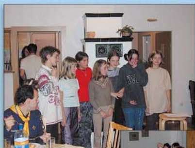
...hráli biblickou hru v okolí, to bylo fajn, nakonec jsme všichni dorazili...