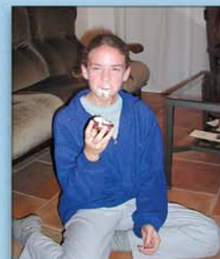
...a byli sladce odměněni...