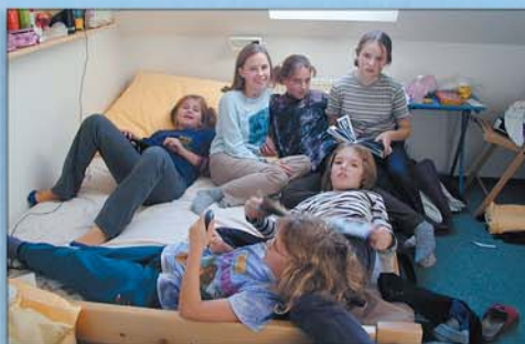
...setkání se všemi kamarády bylo opravdu veselé a nemohlo chybět ani chutné jídlo...