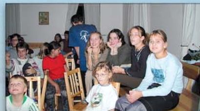
...a tak jsme vzpomínali a vzpomínali...