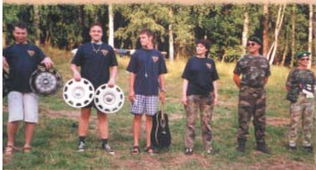
My chceme vlajku!...