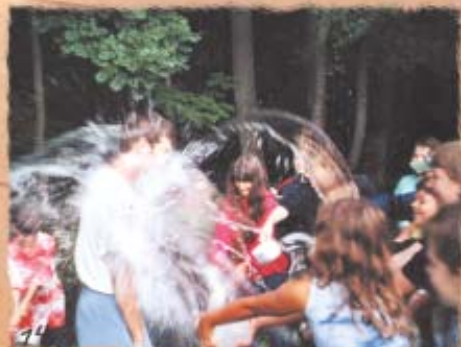
tak a máš to – pořádný monzun, ty ospalče... i když jsi vedoucí