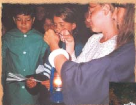
...a zpívali jsme zvesela, dokud nám lampa hořela