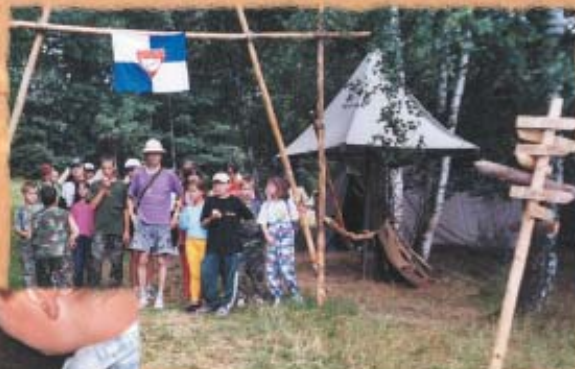
„Profesore Gandalfe, kam se podíváme dnes?“