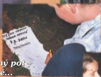
...mráz po zádech a studený pot – roztřesený podpis na hrobě...