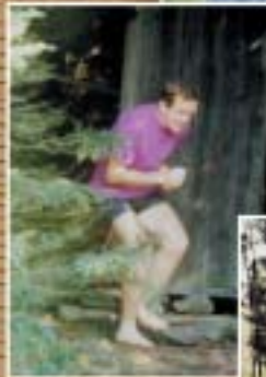
Část našeho nynějšího Pathfinderu...