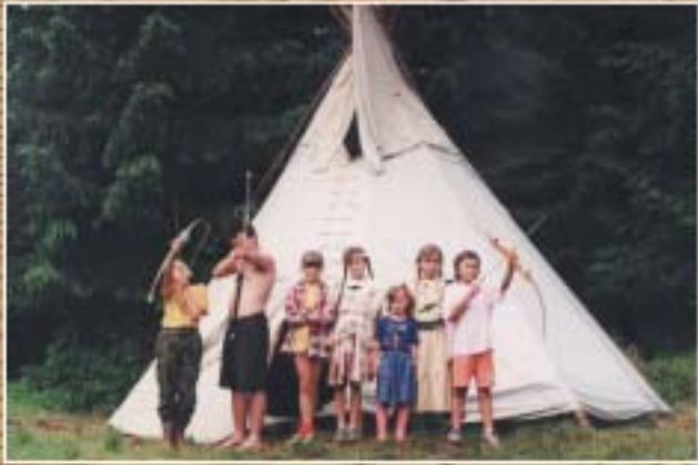
Náš indiánský tábor na Jánské chatě.