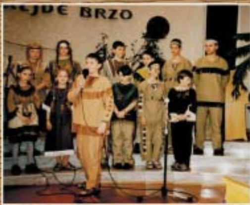
Také jsme nacvičili jeden indiánský program.