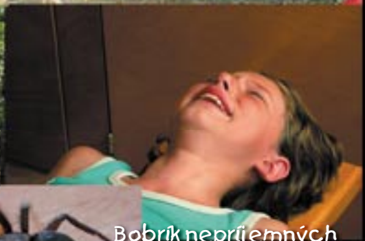
Bobřík nepríjemných pocitov