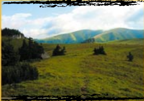
co dodat — nádhera