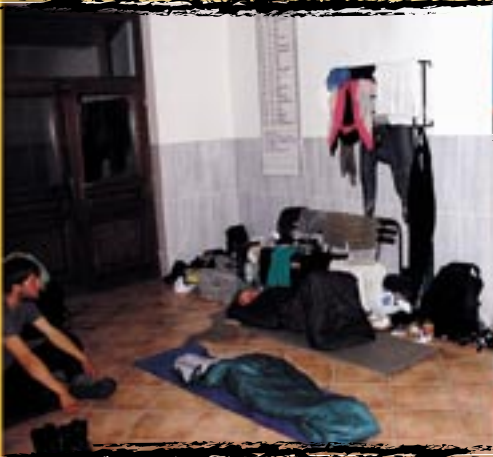
hotel s **** aneb ŽSR nás hostí