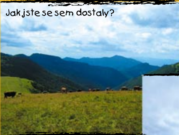
Jak jste se sem dostaly?