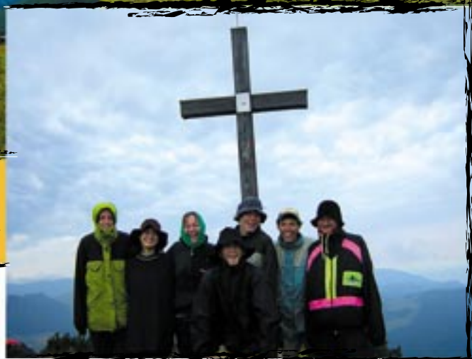
uf to byla fuška