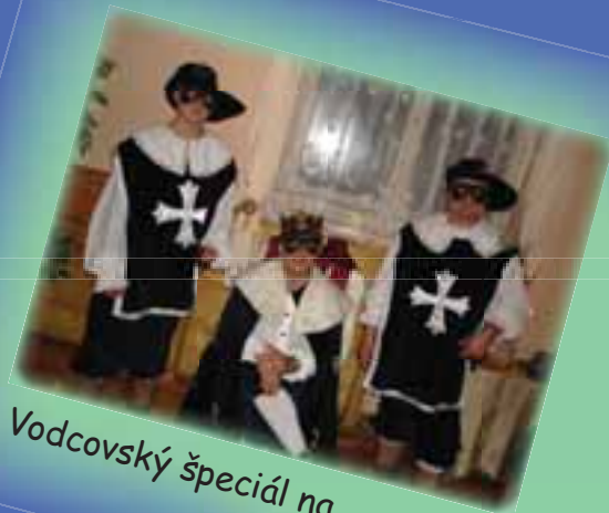
Vodcovský speciál na Martinských Holiach