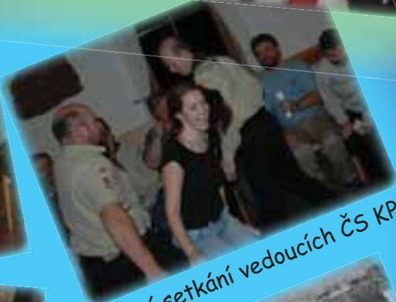
Výroční setkání vedoucích ČS KP