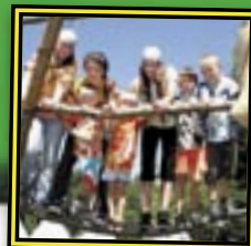
BOBŘI A BOBŘÍCI