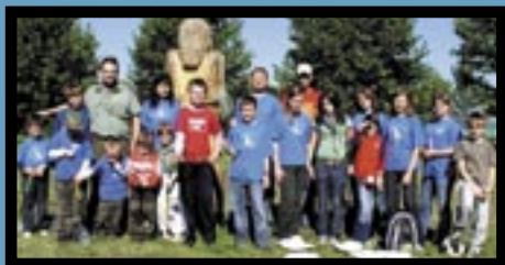
Oddíl Bobři a Bobřici