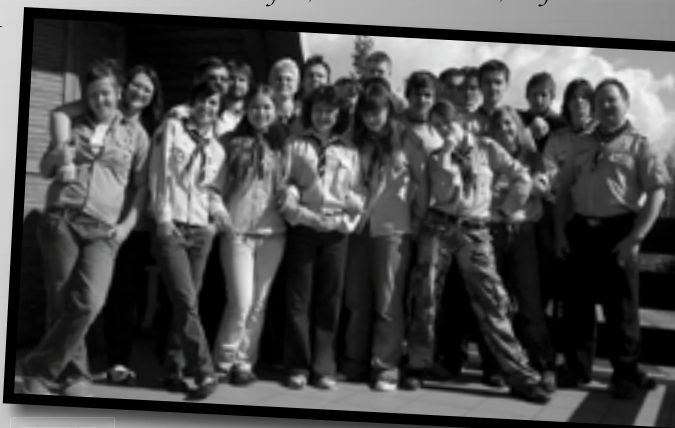
viac fotiek na strane 8...