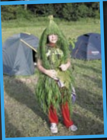
Suchdolu nad Odrou