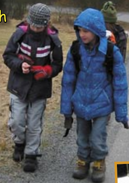
Ararat - Velbloudi