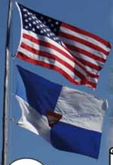
Tady jsem zákon já!