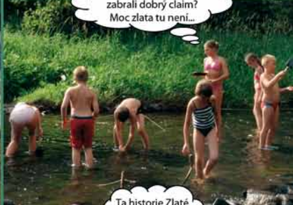
Ta historie Zlaté horečky je tak dramatická...