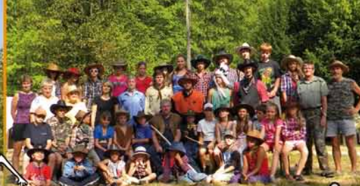
ZLATOKOPOVÉ Z VENDRYNĚ A ZLÍNA