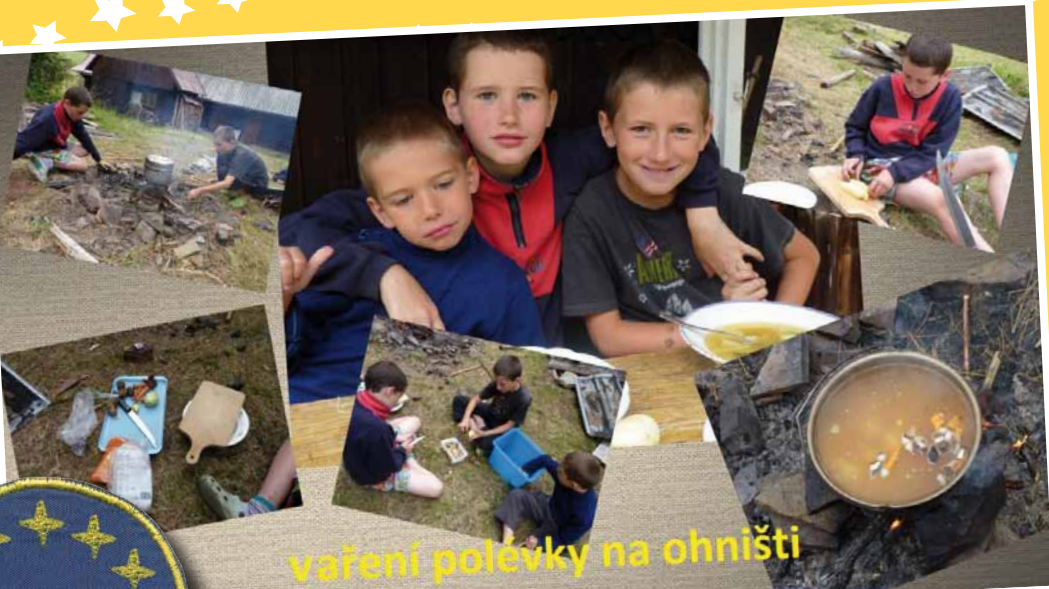
vaření polévky na ohništi