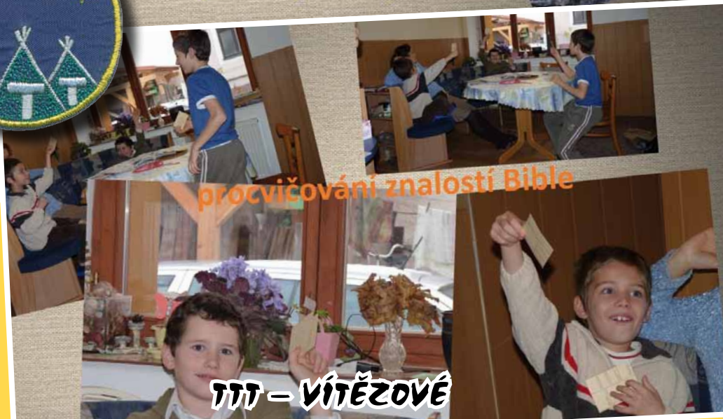
procvičování znalostí Bible