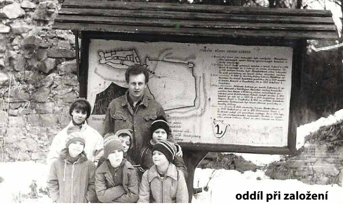
oddíl při založení