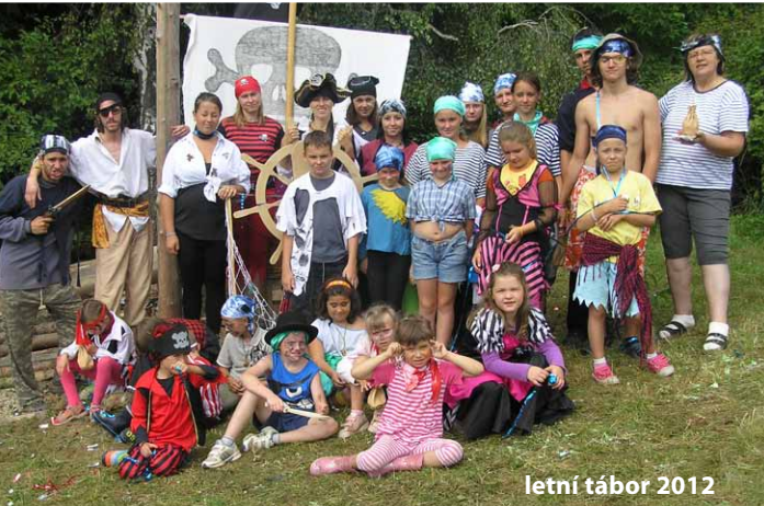
letní tábor 2012