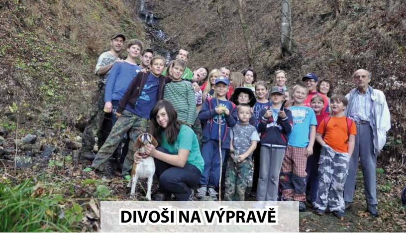
DIVOŠI NA VÝPRAVĚ