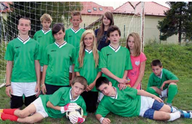
NÁŠ FOTBALOVÝ TÝM