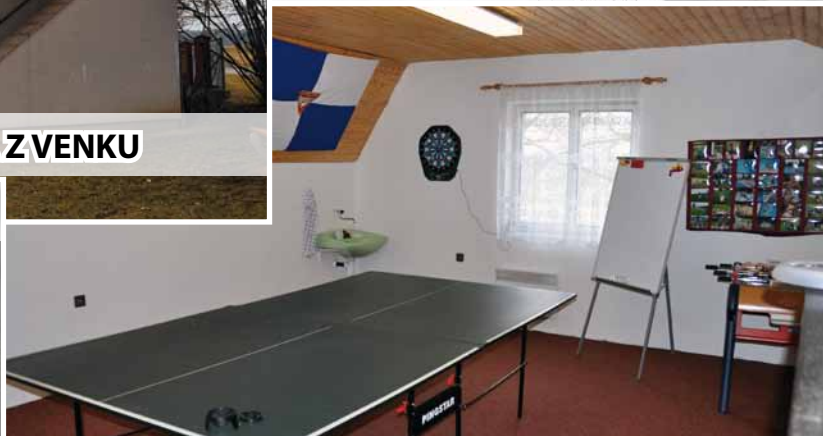
NAŠE KLUBOVNA UVNITŘ