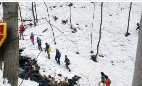
NA CESTĚ K VRCHOLU NEDOSTUPNOSTI