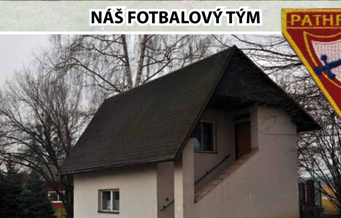
NAŠE KLUBOVNA Z VENKU